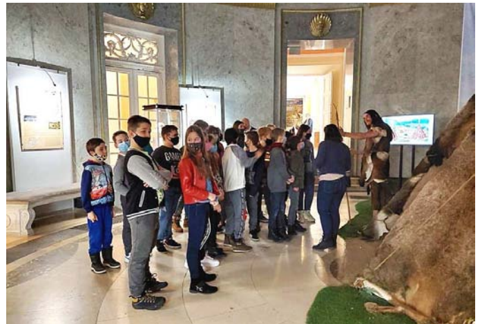
5. osztályosaink a Déri Múzeumban

Tovább folytatódott a Lázár Ervin Program nyújtotta lehetőségek megvalósítása iskolánkban. Ötödikesaink február hónapban a Déri Múzeumba látogattak, ahol a „Csillagok alatt” című kiállítást tekintették meg, és ennek során sok új, érdekes információval bővítették történelmi tudásukat. Ezt követően múzeumpedagógiai foglalkozáson vettek részt. Minden tanulónk feledhetetlen élményekkel gazdagodva tért haza a kirándulásról.