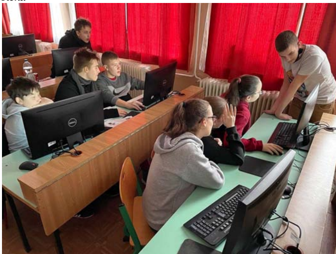
Pillanatkép a versenyen