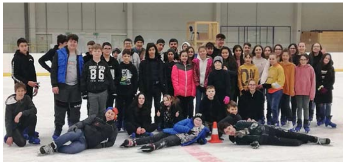
Csoportkép a Debreceni Jégcsarnokban

Az épített jégpályán komoly jégkorongmérkőzések is folytak akkoriban. Sajnos ma már csak a romjai láthatók és az időjárás sem mindig alkalmas a jég készítésre.