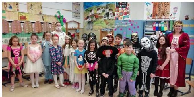
A 2. a és a 2.c osztály

Majd minden alsó tagozatos gyerek és tanító néni jelmezbe bújva mókás, vidám és szórakoztató feladatokkal mulatta át a délutánt.